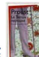
Le Temps retrouvé, Marcel Proust