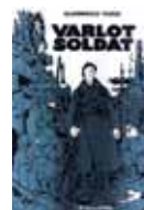
Varlot soldat, Didier Daeninckx, Jacques Tardi