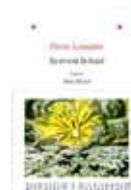
Au revoir là-haut, Pierre Lemaître