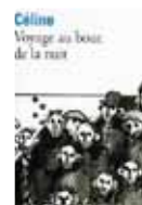
Voyage au bout de la nuit, Louis-Ferdinand Céline