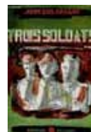
Trois soldats, John Dos Passos