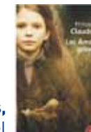
Les âmes grises, Philippe Claudel