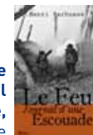
Le feu ; Carnet de guerre : journal d'une escouade, Henri Barbusse