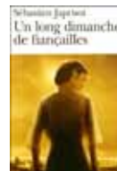
Un long dimanche de fiançailles, Sébastien Japrisot