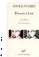
Poèmes à Lou ; précédé de Il y a, Guillaume Apollinaire