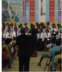
Eglise St Jean Bosco

Entrée 3000 FCFA / gratuit pour les adhérent-e-s