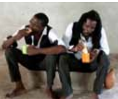
Le théâtre des coulisses