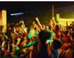
Cercle cult. pour Enfants